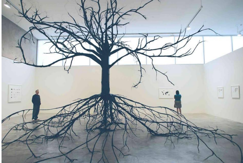
Pilt 3: Suure puu võra ja juurestiku proportsioon