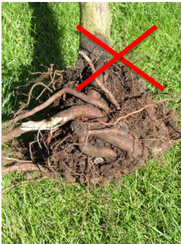
Pilt 1: Keerdjuurtega konteineristik