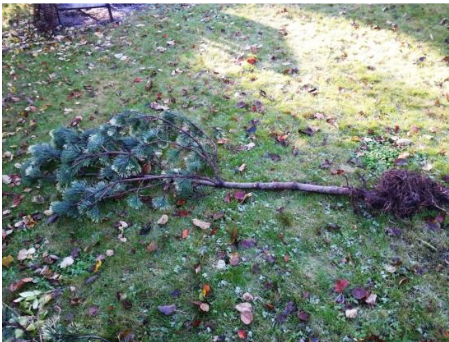
Pilt 2: neliteist aastat mullas „tukkunud“ keerdjuurtega männiistik